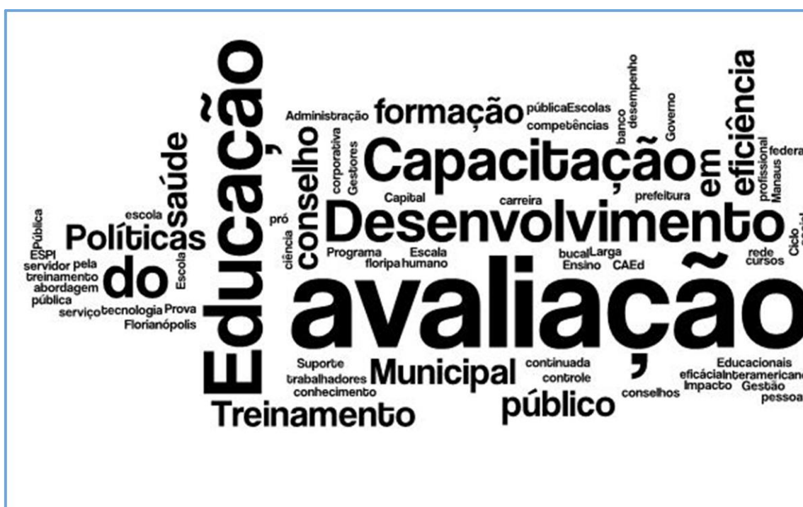
Figura 1: Nuvem de palavras

Foram extraídas as palavras-chave definidas pelos autores no início dos artigos. Em seguida, por meio do recurso Pro Word Cloud do word no Office 365 , obteve-se a nuvem de palavras apresentada na figura 1.